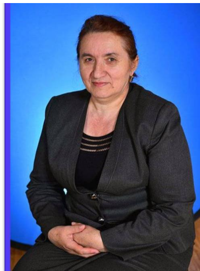
Заведующий МКДОУ «Д/с «Теремок» села Коста Хетагурова