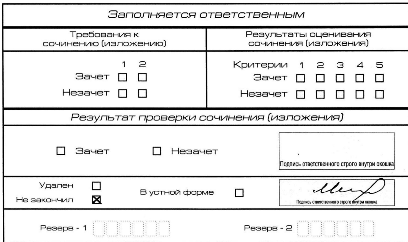
Рис. 10. Заполнение полей нижней части бланка регистрации (участник не закончил написание сочинения (изложения) по уважительным причинам)